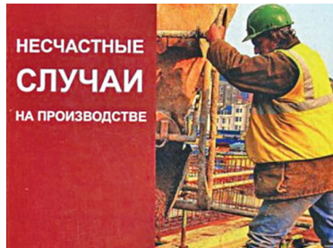
НЕСЧАСТНЫЕ СЛУЧАИ НА ПРОИЗВОДСТВЕ

ФСС РФ подготовлен обзор наиболее часто поступающих вопросов, касающихся несчастных случаев на производстве. В частности, сообщается: