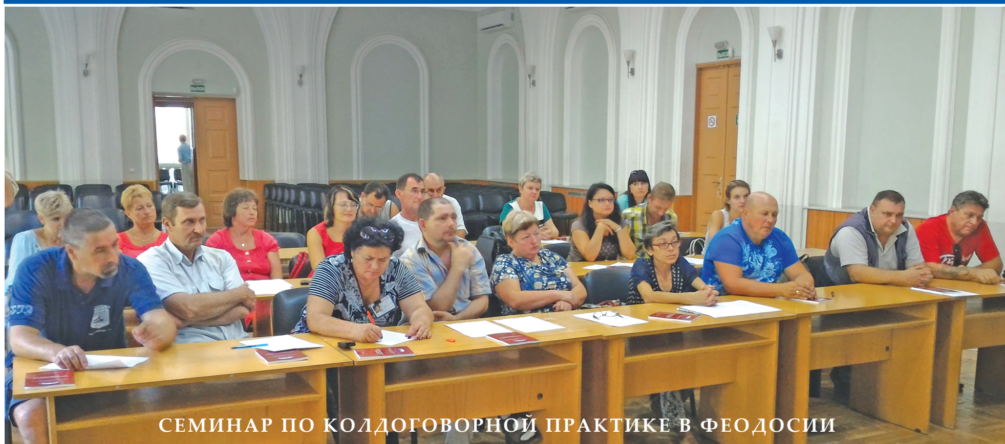
СМИНАР ПО КОЛДОГОВОРНОЙ ПРАКТИКЕ В ФЕОДОСИИ